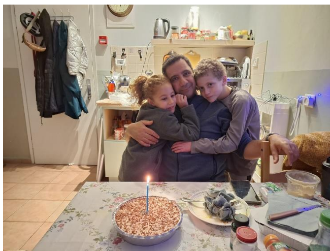
בבית אלפא בסוף דצמבר יום הולדת לאבי

אני מאד אוהבת את המקום הזה יש בו אנרגיות טובות (לא פלא שהרבה יוצרים ואמנים ישבו בו), אבל יודעת שאין זה המקום שלי. ההתמודדות האמיתית עוד לפנינו. לפעמים יש לי הרגשה שיש בי בור שקשה למלא של אין, של חוסר. מצב הרוח עולה ויורד ולפעמים בא לידי ביטוי בהרגשה פיזית קשה וגם בחולי. עם זאת אני מוכנה להיות פה עד שיהיה פתרון שלם ומחזקת את המאמצים של הצבא והנהגת המדינה להשיגו. אני מוכנה לתת להם כמה זמן. שצריך כדי שנוכל לחזור לביתנו לא כפי שיצאנו ממנו ולא כפי שהוא עכשיו.