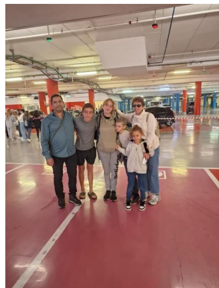
מלווים את שקד ללשכת הגיוס.